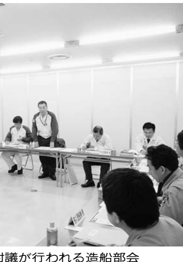
白熱した討議が行われる造船部会

同市内の展示場「テクノポート今治」で行われる。同展は、国内最大級の海事関連企業で構成される「今治海事都市交流委員会」が特別後援する。また、国内外の造船会社やMPレックスメディア(本社・東京・クリスタル・イブ社長)が主催し、国土交通省や海事関連の講演会やセミナーなど、イベントなども実施される予定。