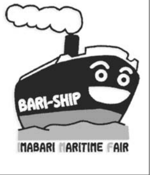
BARI-SHIP IABARI MARITIME FAIR

愛媛県今治市で5月21、23日に開催される「今治海事展(BARI-SHIP I)」の造船や船舶、海運の海事産業が集結する「日本最大の海事都市・今治」を全国や世界に向けて発信し、地域振興につなげようとする試みの準備が着々と進んでいる。